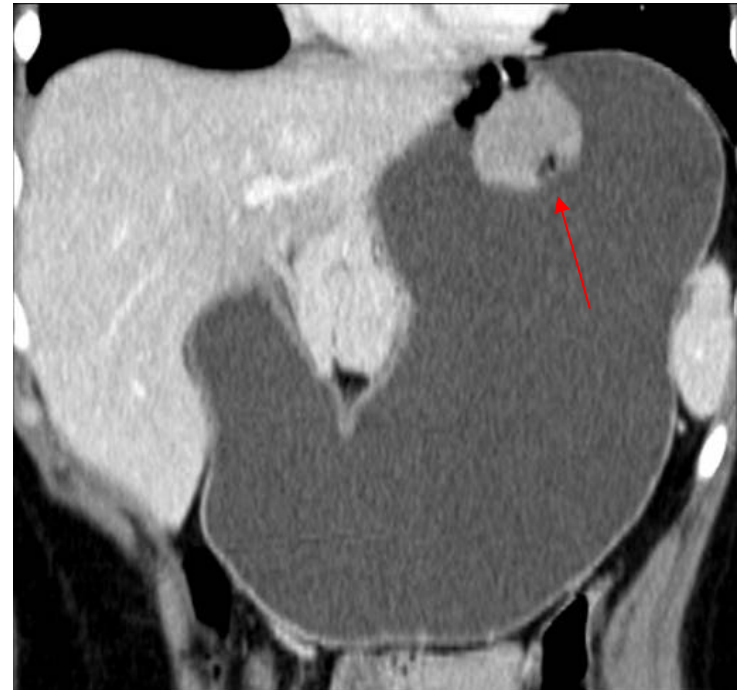
TDM avec balisage digestif à l'eau Tumeur stromale du cardia

sarcome de Kaposi, tumeur neuro endocrine,