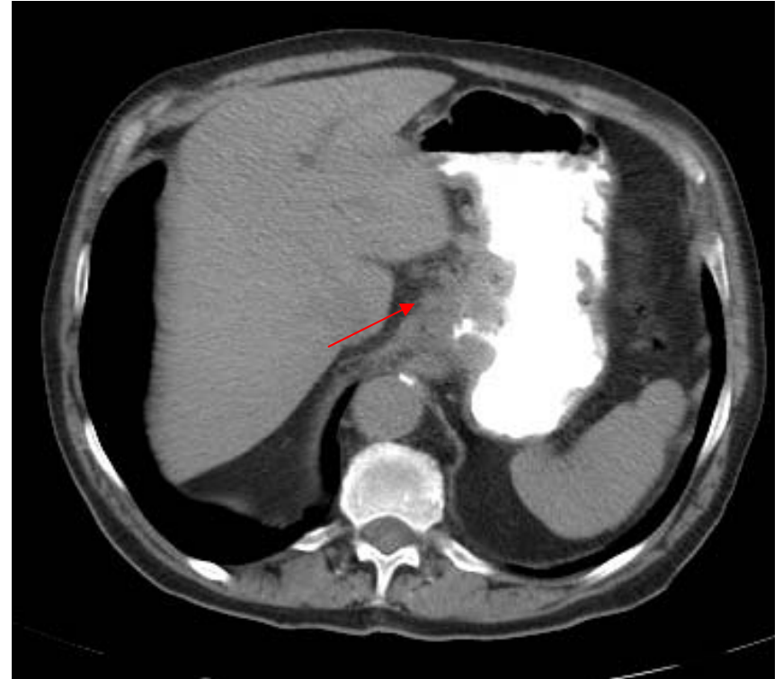
TDM avec balisage aux hydrosolubles Cancer du cardia, adénomégalies