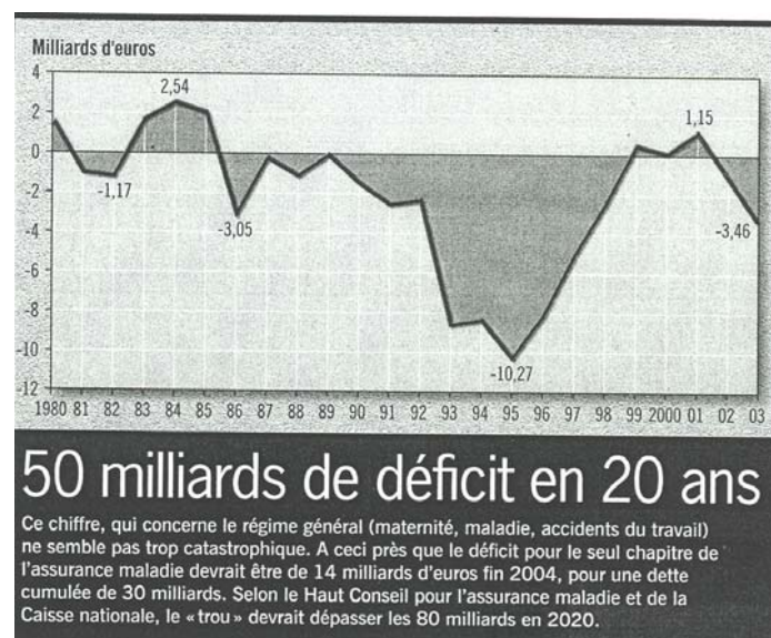
Figure 2 - Historia – juin 2004 - « La sécu : bientôt 60 ans et mal en point » C. Courau, p. 14-17.

Les deux facteurs précédents (chômage et vieillissement de la population) expliquent, en grande partie, le déséquilibre croissant présent et futur des budgets sociaux : le fameux " trou de la sécurité sociale ", que les gouvernements successifs s'efforcent de combler sans succès (figure 2). On constate en effet que ces budgets sociaux consomment une part croissante du PIB (29,4 % en 2006), quelle que soit la conjoncture économique (croissance ou récession, avec toutefois une accélération en cas de récession).