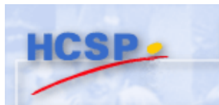
Haut Conseil de la Santé Publique